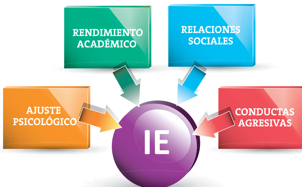
Figura 2. EFECTOS COMPROBADOS DE LA IE EN ADOLESCENTES

Los adolescentes con baja IE poseen peores habilidades interpersonales y sociales, lo que puede generar el desarrollo de conductas de riesgo. La investigación indica que los adolescentes con una menor IE tienen más posibilidades de consumir drogas como tabaco y alcohol, o drogas ilegales como cannabis o cocaína. Los adolescentes con una mayor habilidad para manejar sus emociones son capaces de afrontarlas de forma adaptativa en su vida cotidiana, teniendo como consecuencia un mejor ajuste psicológico, una menor búsqueda de sensaciones y un menor consumo de drogas.