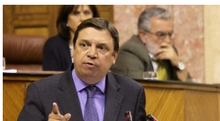
Luis Planas, Ministro de Agricultura, Pesca y Alimentación