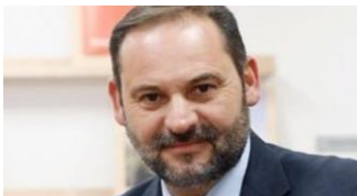
José Luis Ábalos, Ministro de Fomento