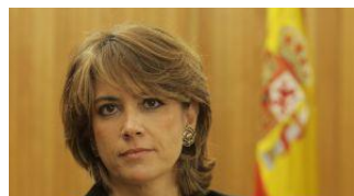
Dolores Delgado, Ministra de Justicia