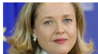
Nadia Calviño, Ministra de Economía y Empresa