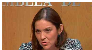
Reyes Maroto, Ministra de Industria, Comercio y Turismo