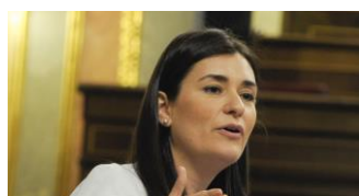
Carmen Montón, Ministra de Sanidad, Consumo y Bienestar Social