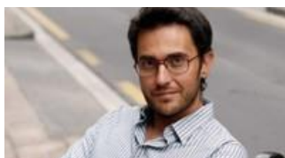
Maxim Huerta, Ministro de Cultura y Deporte