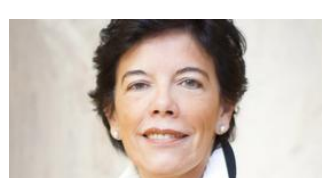
Isabel Celaá, Ministra Portavoz y Ministra de Educación y Formación Profesional