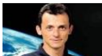
Pedro Duque, Ministro de Ciencia, Innovación y Universidades