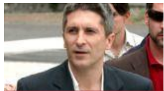
Fernando Grande Marlaska, Ministro de Interior