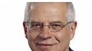
Josep Borrell, Ministro de Asuntos Exteriores, Unión Europea y Cooperación