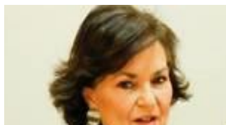
Carmen Calvo, Ministra de la Presidencia, Relaciones con las Cortes e Igualdad