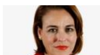
Magdalena Valerio, Ministra de Trabajo, Migraciones y Seguridad Social.