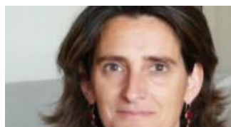
Teresa Ribera, Ministra para la Transición Ecológica