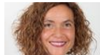
Meritxell Batet, Ministra de Política Territorial y Función Pública