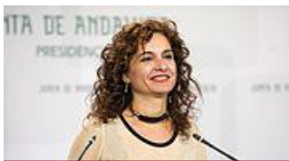
María Jesús Montero, Ministra de Hacienda